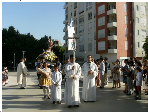
Paróquia do Parque das Nações - 2014

Paróquia de Malpica do Tejo Paróquia de Perais Paróquia de Vila Velha de Ródão Paróquia do Fratel Paróquia de Santana Paróquia de Amieira do Tejo Paróquia de Ortiga Paróquia de Alvega Paróquia de Mouriscas Paróquia do Pego Paróquia de Alferrarede Paróquia de Abrantes Paróquia do Rossio ao Sul do Tejo Paróquia do Tramagal Paróquia de Rio de Moinhos Paróquia de Constância Paróquia da Praia do Ribatejo Paróquia de Tancos Paróquia do Arripiado Paróquia de Vila Nova da Barquinha Paróquia de Chamusca Paróquia de Azinhaga Paróquia de Alpiarça Paróquia de Vale de Figueira (Santarém) Paróquia de Santa Iria da Ribeira de Santarém Paróquia de Marvila (Santarém-Caneiras) Paróquia de Benfica do Ribatejo (Almeirim) Paróquia de Valada do Ribatejo (Cartaxo) Paróquia de Salvaterra de Magos (aldeia do Escaroupim) Paróquia de Azambuja (aldeia do Porto da Palha) Paróquia de Vila Franca Paróquia de Alhandra Paróquia da Póvoa de Santa Iria Paróquia do Parque das Nações Paróquia de Alcochete Paróquia da Montijo Paróquia do Moita Paróquia de Paço de Arcos Paróquia de Oeiras Paróquia de São João da Barra