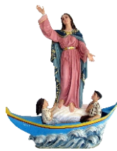
Nossa Senhora dos Avieiros e do Tejo