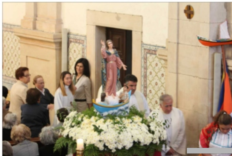
Nossa Senhora do Avieiros e do Tejo