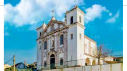
Igreja de S. Marcos - Arripiado