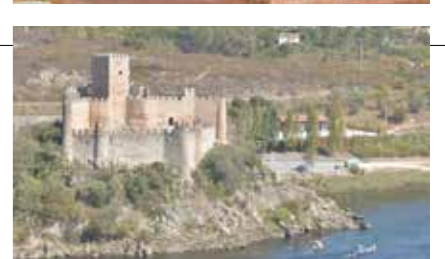
Passeio de barco ao Castelo de Almourol