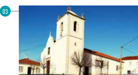
Pinheiro Grande - Igreja