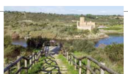
"Miradouro do Almourol"