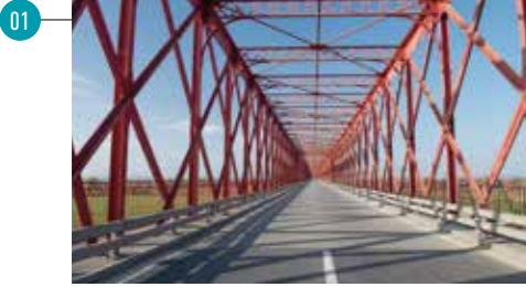
Ponte da Chamusca