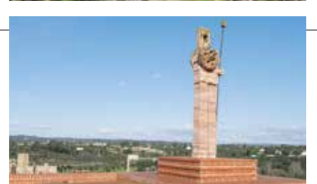
Escultura de Mestre João Cutileiro