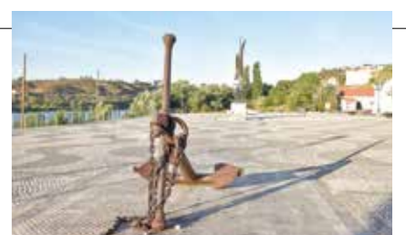
Zona ribeirinha do Arripiado