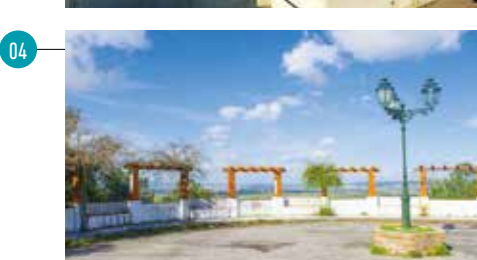
Cabeças do Pinheiro - vista do miradouro