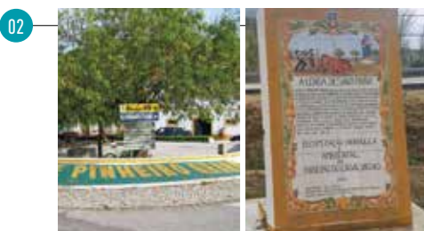
Dique do Ribeiro Casal Velho (Pinheiro Grande)