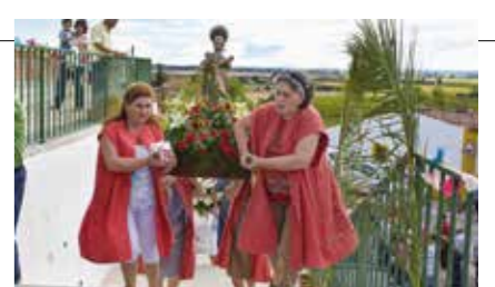
Festa do Arripiado - Procissão