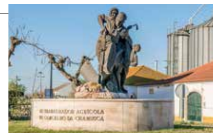
Estátua de homenagem ao Trabalhador Agrícola do Concelho da Chamusca