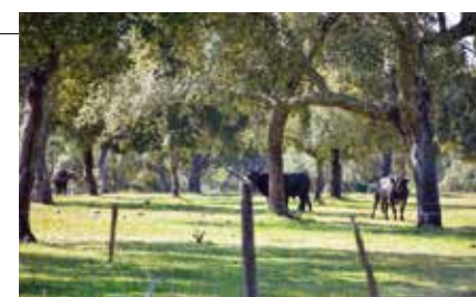
Pego da Curva em direcção do Casal do Gorjão