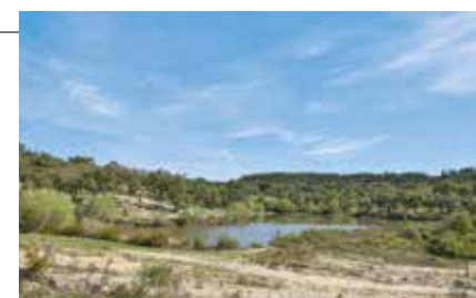
Parreira – floresta