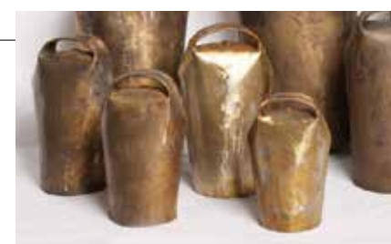
Chouto – Feira do Chocalho