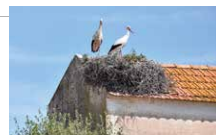
Casal do Gorjão