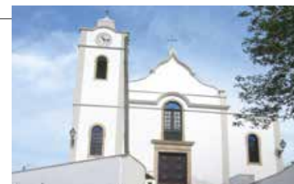
Vale de Cavalos – Igreja do Divino Espírito Santo