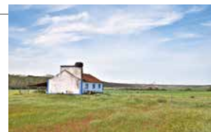
Paisagem entre Vale de Cavalos e Parreira