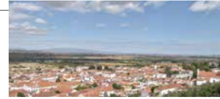
Vista do Miradouro Sra. do Pranto