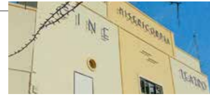
Cineteatro da Chamusca