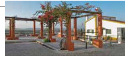
Vista do Miradouro de S. Francisco