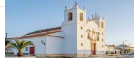
Igreja da Misericórdia