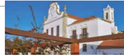
Edifício São Francisco