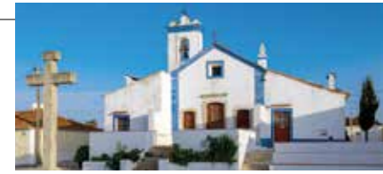
Sra. do Pranto