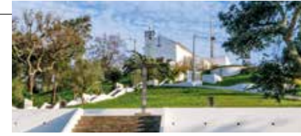
Sra. do Bonfim