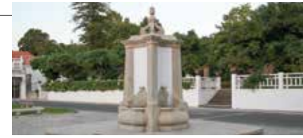
Chafariz Branca de Neve