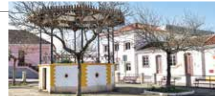
Jardim do Coreto