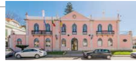
Edifício Paços do Concelho